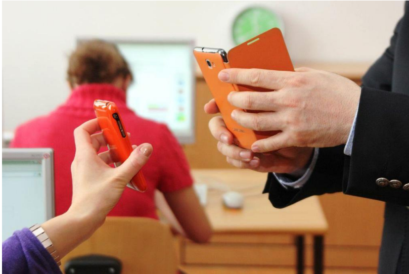
Lernen mit Smartphones

Als langjährige Kooperationspartner arbeiten die Berufsorientierungs- und IT-Team der NMS-Schopenhauerstraße und BHS/BMS-Kalvarienberggasse nun auch als Partner im BMUKK-Projekt „Mobile Lernbegleiter im Unterricht“ und motivieren somit SchülerInnen zum kompetenzorientierten Handeln im EDV-Bereich.